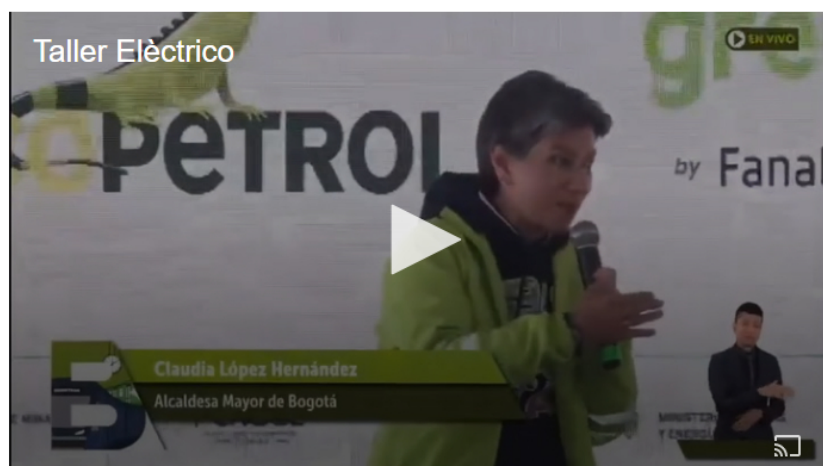
La alcaldesa presentó el primer taller para cargar buses con hidrógeno

La alcaldesa aseguró que el taller es el primero en Colombia con capacidad de cargar un bus de servicio público con hidrógeno para Bogotá y para el país. López añadió que este será el primer patio para la medida de transición energética, pero no el último .