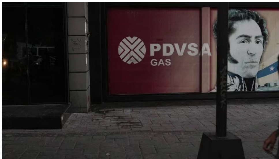
Según el Ministerio Público de Venezuela, son casi 30 las investigaciones sobre PDVSA desde 2017.

Entre los detenidos se encuentran vicepresidentes de PDVSA, exdiputados y altos directivos de la petrolera, alcaldes y jueces, a quienes se les imputan los delitos de apropiación de patrimonio público, legitimación de capitales y traición a la patria. En el caso de los empresarios del sector privado, ya han sido detenidos 11.