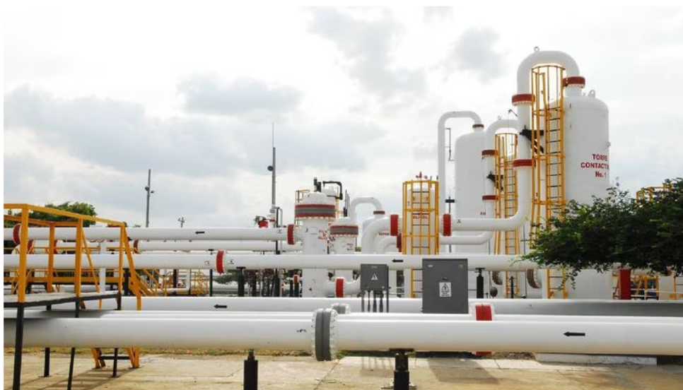
Este es uno de los gasoductos con los que se garantiza el suministro de gas natural para todos los sectores de Colombia.

“Si bien es cierto Bernardo Arosio no tiene ninguna participación en Integral Energy Plus S. A. S. su calidad de socio en Prodata Energy C. A. de la cuales