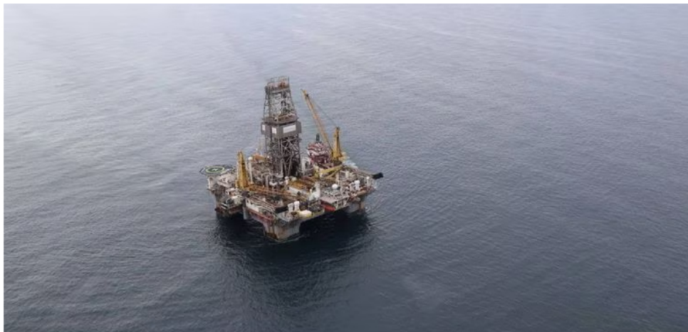
El pozo Uchuva-1 está a cerca de 80 kilómetros del campo de gas Chuchupa, dos de los campos de producción de gas de Colombia.

“Si bien es cierto Bernardo Arosio no tiene ninguna participación en Integral Energy Plus S. A. S. su calidad de socio en Prodata Energy C. A. de la cuales