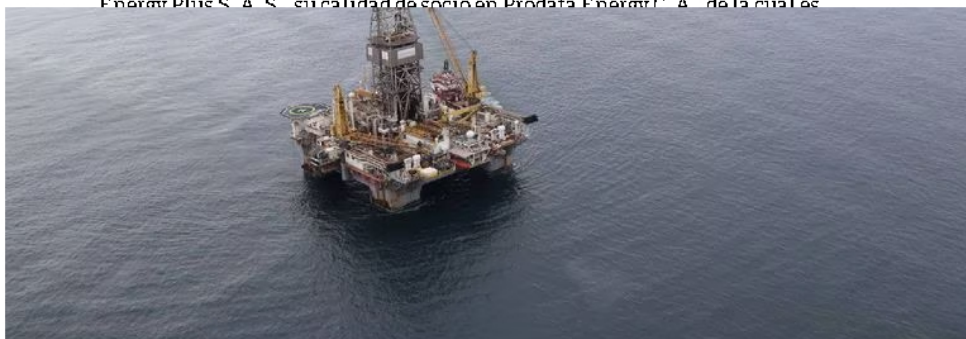
El pozo Uchuva-1 está a cerca de 80 kilómetros del campo de gas Chuchupa, dos de los campos de producción de gas de Colombia.

“Si bien es cierto Bernardo Arosio no tiene ninguna participación en Integral Energy Plus S. A. S. su calidad de socio en Prodata Energy C. A. de la cuales