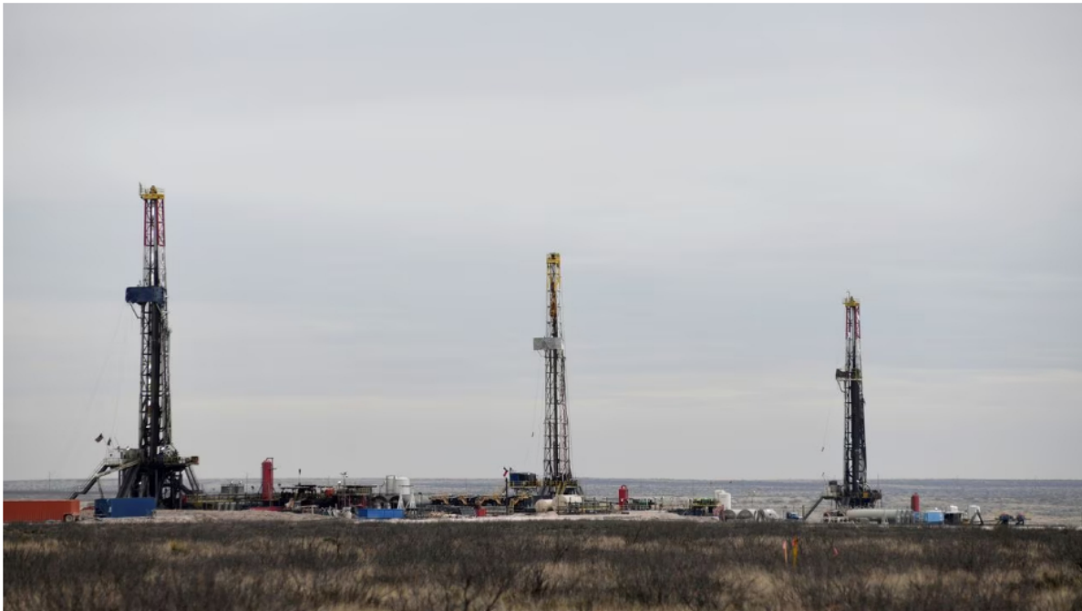
Imagen de referencia de un campo de producción de gas.

Pese a toda la polémica que se ha generado por la propuesta de importar gas de Venezuela, dos empresas, una colombiana y otra del vecino país, venían avanzando para cumplir ese objetivo. Se trata de Prodata Energy C. A. e Integral Energy Plus S. A. S. Los accionistas de esta última se reunieron el sábado 25 de marzo y tomaron la decisión de frenar el proyecto.