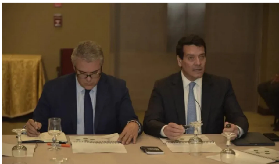
Iván Duque le dio continuidad a Felipe Bayón como presidente de Ecopetrol.

El expresidente de Ecopetrol Felipe Bayón recibió críticas por parte del exsenador del Pacto Histórico Gustavo Bolívar por recientes declaraciones sobre la empresa que lidera hasta el 31 de marzo de 2023.