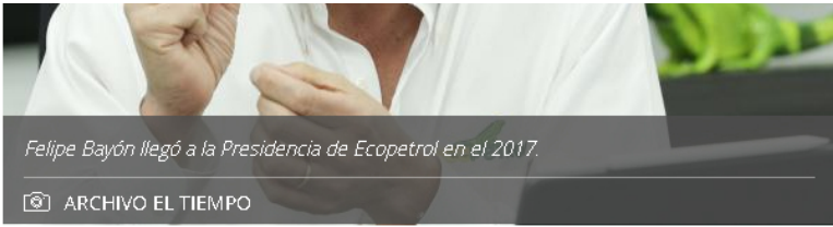
Felipe Bayón llegó a la Presidencia de Ecopetrol en el 2017.