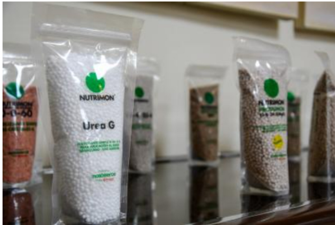
La empresa colombiana venezolana fabrica productos de agroindustria

que la empresa colombiana venezolana es la única que cuenta con licencia de la Oficina de Control de Activos Extranjeros (OFAC) de Estados Unidos.