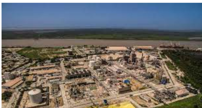
Empresa Monómeros

Así rechaza el anuncio de compra informado por Armando Benedetti, embajador de Colombia en Venezuela, el jueves 23 de marzo.