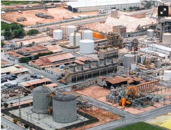
Sede de Monómeros en Barranquilla

Manifestó que de existir esta posibilidad se debe evaluar por las sanciones económicas de Estados Unidos a Venezuela.