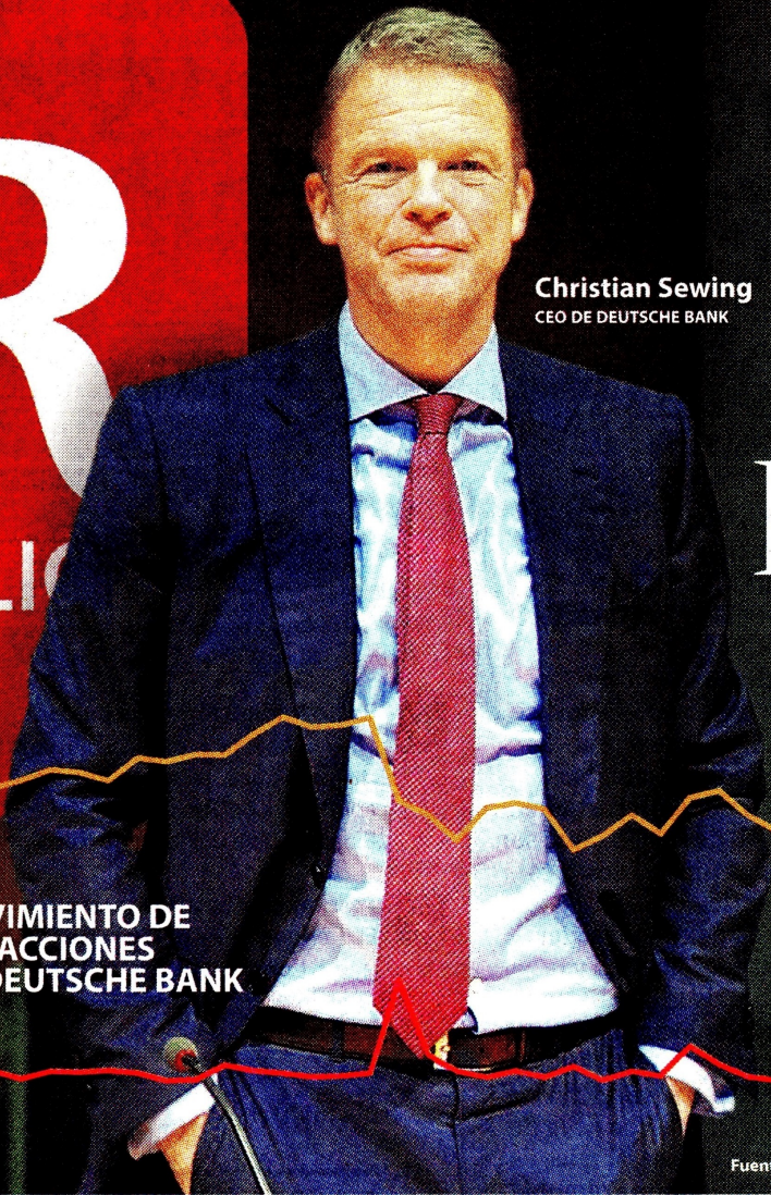
Christian Sewing CEO DE DEUTSCHE BANK

BOLSAS. LOS ÍNDICES BURSÁTILES DE EUROPA SINTIERON COLETAZO