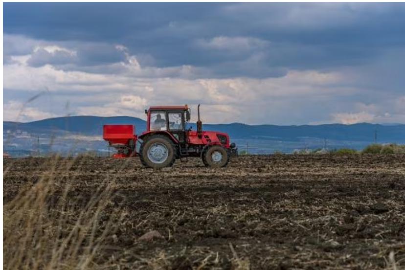
Monómeros, que cuenta con una planta de producción en Barranquilla y otra en Buenaventura, atiende el 40 % del mercado de fertilizantes y de insumos agroindustriales en Colombia.

Además, declaraciones de las directivas que estaban al frente de la misma, en la primera mitad de 2022, manifestaron que la empresa contaba con una capacidad instalada para producir y comercializar el 52 % de los insumos necesarios para los mercados agrícola y pecuario actual (unas 960.000 toneladas) y planeaba una ampliación.