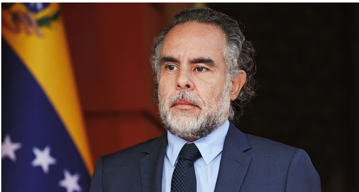
Armando Benedetti, embajador de Colombia en Venezuela, expresó que el Gobierno nacional está adelantando negociaciones para adquirir la empresa de fertilizantes Monómeros, filial en Colombia de la petrolera venezolana PDVSA.

manifestó que “sería positivo que Colombia comprara Monómeros” . Sin embargo, dejó claro que esta posibilidad se debe evaluar en el marco de las relaciones con los Estados Unidos y las sanciones que ese país ha impuesto a empresas venezolanas.