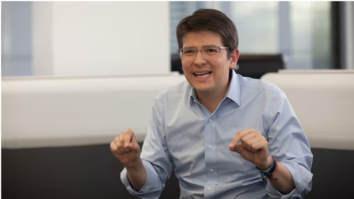
El senador Miguel Uribe fue uno de los más críticos con la ministra

Así quedó en evidencia durante el transcurso del debate. Desde el Centro Democrático y Cambio Radical no perdieron oportunidad para asegurar que la ministra estaría poniendo en riesgo la seguridad minero-energética.