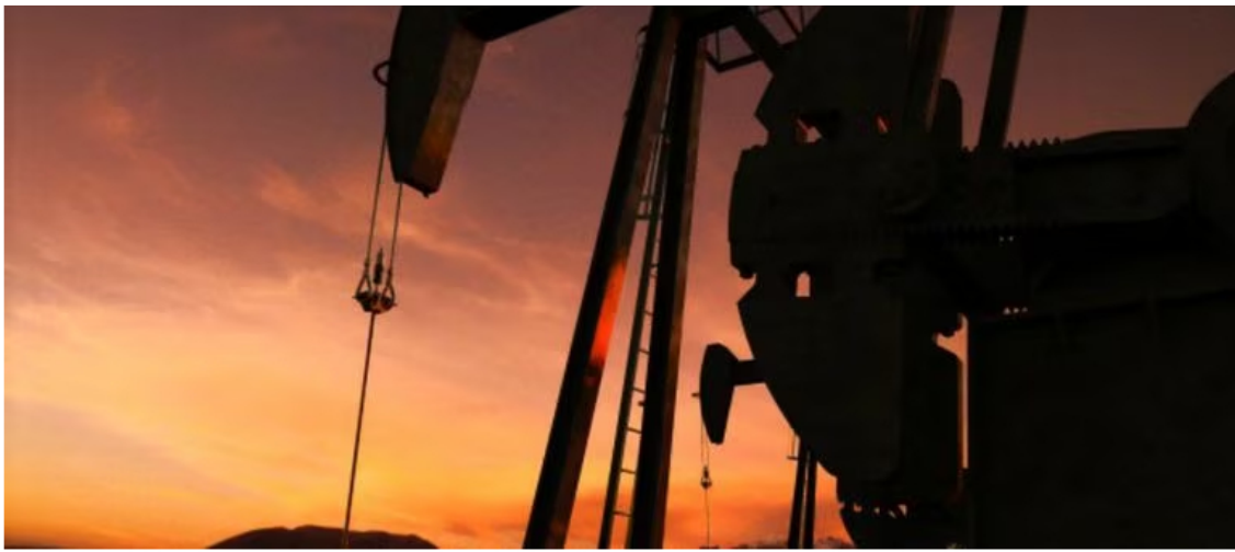
La ministra Irene Vélez ha sido cuestionada por la posibilidad de que se suspenda la exploración de petróleo

No obstante, las dudas llegaron por cuenta del Partido Conservador, colectividad que pertenece a la coalición de Gobierno, pero que puso en duda su apoyo a la funcionaria del Gobierno Petro.