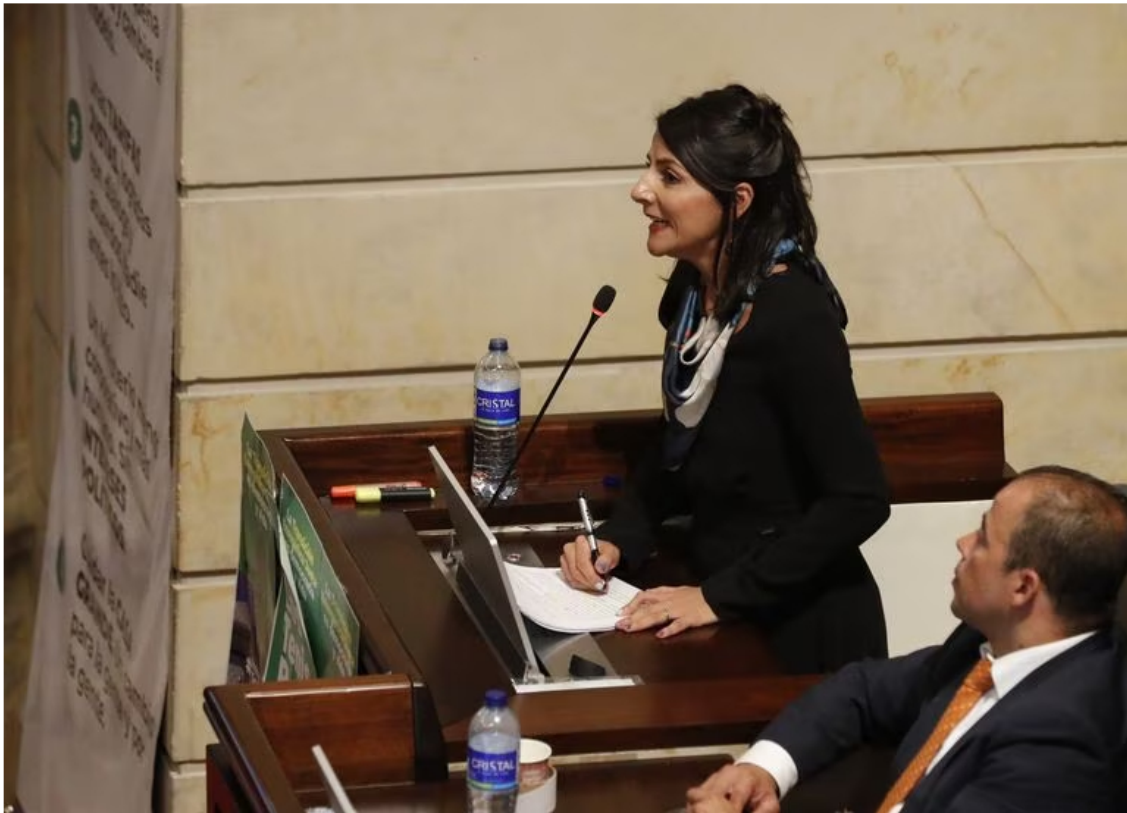
La ministra dio un parte de tranquilidad sobre la posibilidad de un apagón

Y agregó: “Que los campesinos(as) puedan asociarse para generar energía, que los barrios puedan asociarse para generar energía, que las instituciones de educación puedan estar ahí autogenerando e incluso generando excedentes que puedan ser incluidos en la red”.