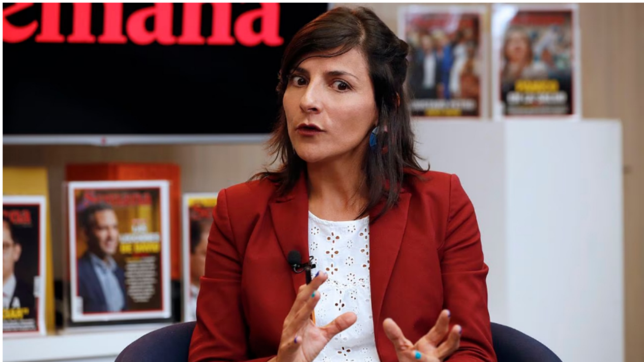
Ministra Minas y Energía, Irene Vélez Torres, enfrentó su segunda moción de censura

Aunque en las últimas semanas ha manejado un bajo perfil, luego de las controversias que venía protagonizando, la ministra de Minas y Energía, Irene Vélez, ha sido una de las funcionarias más polémicas de la administración de Gustavo Petro.