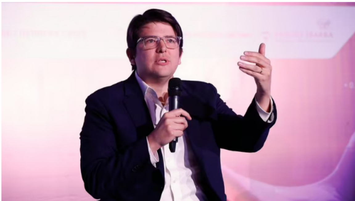
Miguel Uribe, senador del Centro Democrático.