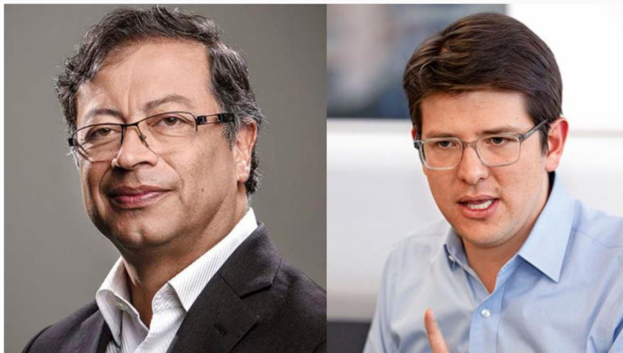
El presidente Gustavo Petro y el senador Miguel Uribe.