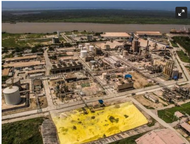
Monómeros Colombo Venezolanos.