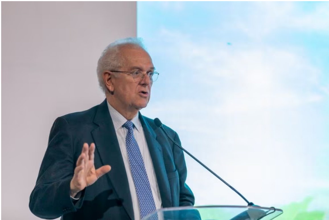
José Antonio Ocampo resaltó que el cobre puede ser clave para la nación si se empieza a priorizar.

Esta declaración causó inmediatamente una reacción el ministro de Hacienda, José Antonio Ocampo, quien, de hecho, lo han catalogado como el “apaga incendios del gobierno Petro”.