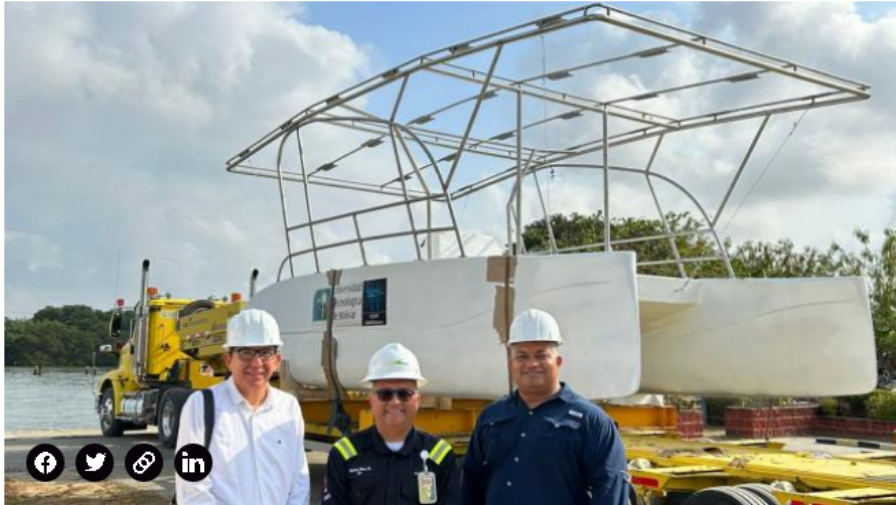
AquaBus-e para Cartagena