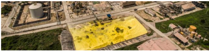
Planta Industrial Monómeros en Barranquilla

Una de estas es la solicitud del propio Gustavo Petro de que se investigue a su hijo. Pero ya antes venía caminando otra investigación sobre irregularidades en jugosos contratos.