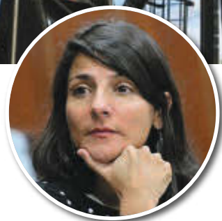
IRENE VÉLEZ Ministra de Minas y Energía

La solicitud de suspensión más reciente fue presentada por Emerald Energy para el bloque Ombú, ubicado en Caquetá, en donde extrajo 1.939 barriles en promedio por día en 2022.