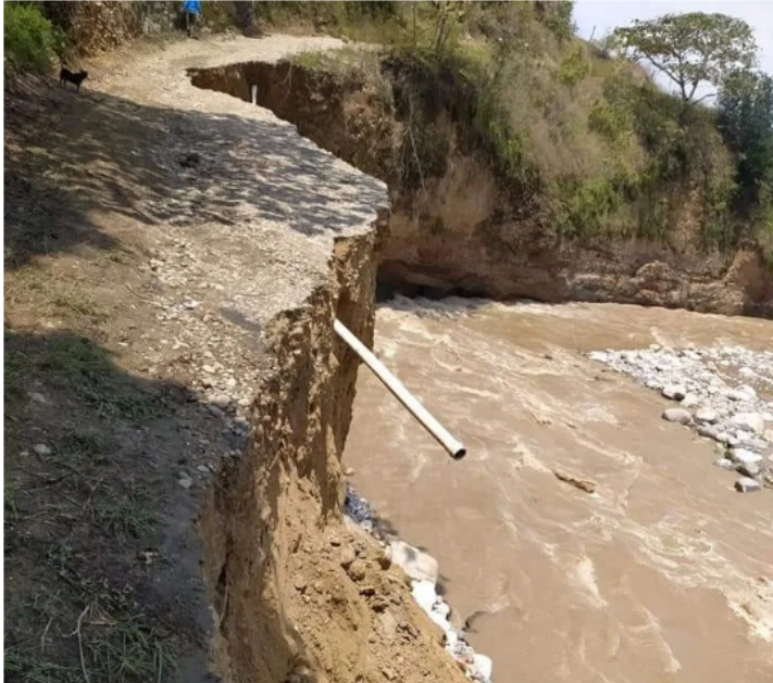
No quedó por donde pasar.