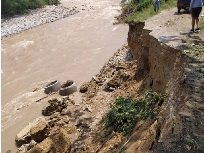
El río se llevó la banca de la carretera.

Así lo manifestaron Diario del Huila, los habitantes del sector afectado que se ve afectado por el mal estado de la vía y la imposibilidad de entrar o salir por la vía actual, cuya banca se llevó el río Fortalecillas.