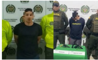
JUDICIAL / 1 mes ago Estos son los Capturados presuntos responsables del homicidio de niña de 13 años