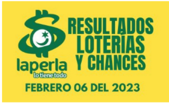
AZAR / 1 mes ago Resultados loterías y chances del Lunes 6 de Febrero del 2023