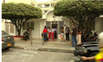
JUDICIAL / 1 mes ago Muere una niña de 15 años al ingresar al colegio Bethlemitas