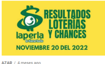
AZAR / 4 meses ago Resultados de loterías y chances el día 20 de Noviembre