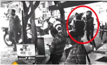
ACTUALIDAD / 1 mes ago Impactante video del ataque sicarial en el corregimiento El Centro