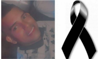
ACTUALIDAD / 1 mes ago Segundo asesinato en menos de 24 horas en Barrancabermeja