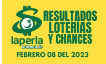
AZAR / 1 mes ago Resultados de chances y loterías del 8 de febrero del 2023