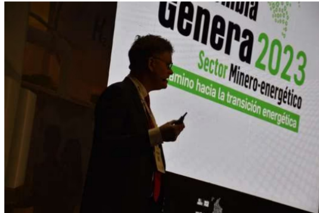
En su primer día de Colombia Genera, se hizo entrega de la publicación, " Barómetro Petróleo 2023", una muestra de la percepción ciudadana frente a la actividad petrolera en los territorios.