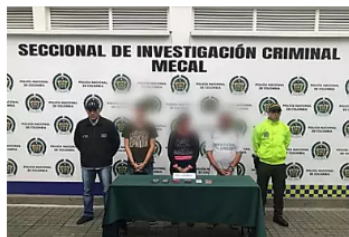
Pornografía infantil: madre, padrastro y