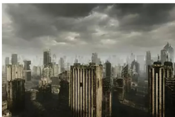
Fin del mundo podría ser pronto: la