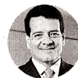
Felipe Bayón Presidente de Ecopetrol

www.larepublica.co Para conocer cuáles fueron los resultados financieros de Ecopetrol en 2022.