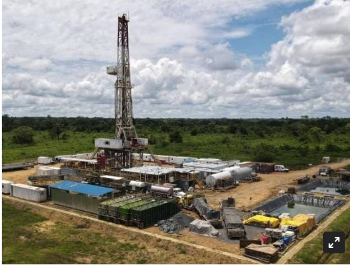
Hocol confirma nuevo hallazgo de gas en el departamento de Córdoba.

La compañía manifestó que este descubrimiento permite que se continúe avanzando hacia la transición energética.