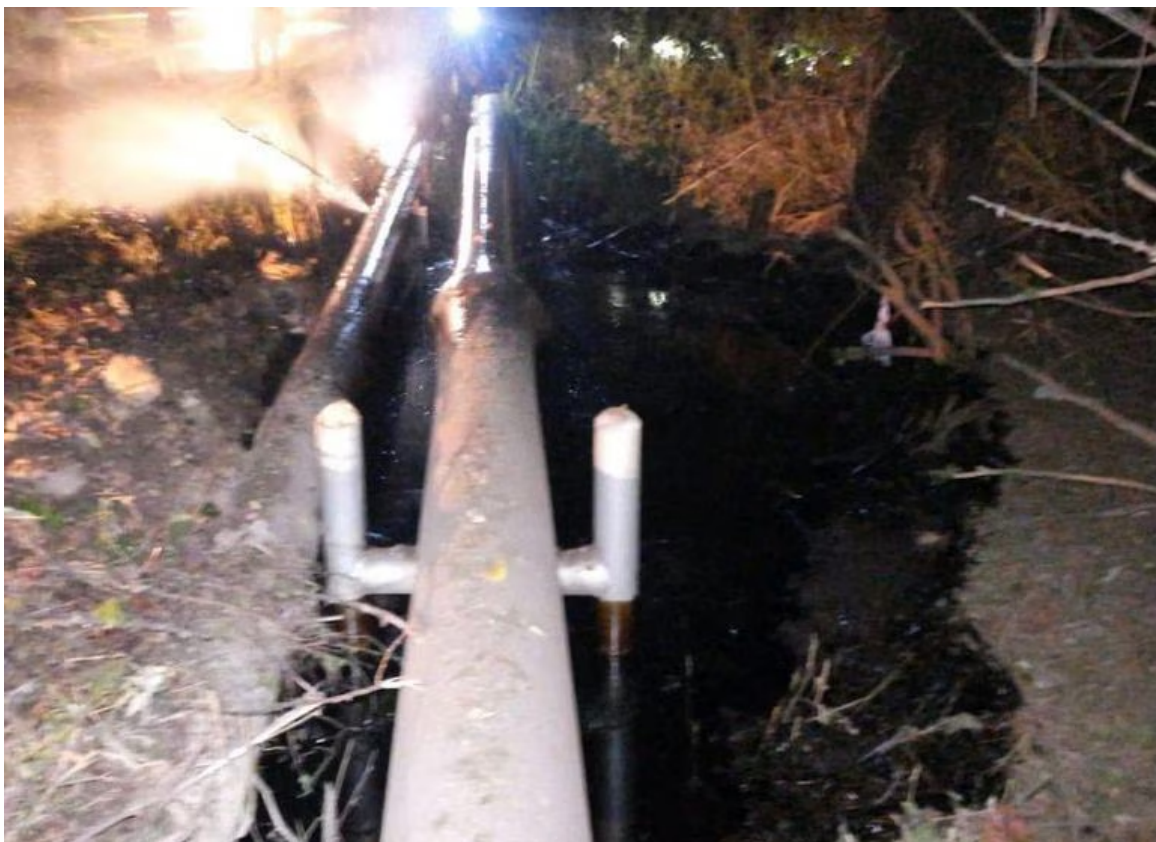
Imagen de referencia.

La entidad recalcó que este ataque fue “perpetrado por terceros desconocidos a la infraestructura del Oleoducto Caño Limón-Coveñas sobre la vereda El Consuelo, zona rural del municipio de Saravena, Arauca”.