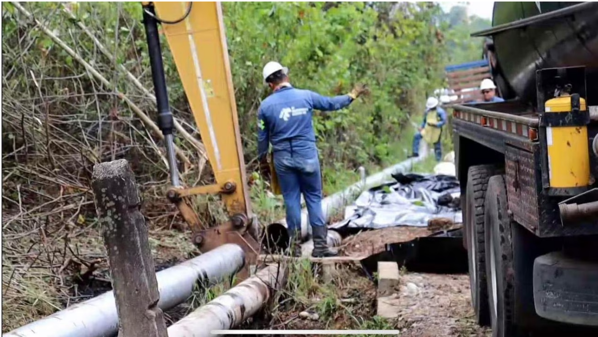
Este departamento ha registrado múltiples ataques.