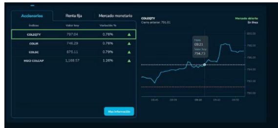
De acuerdo con los reportes de apertura para esta jornada, el índice MSCI Colcap inició en 1.168,57 unidades, creciendo de esta forma un 1,26% respecto a las 1.154 de la jornada anterior.

De acuerdo con los reportes de apertura para esta jornada, el índice MSCI Colcap inició en 1.168,57 unidades, creciendo de esta forma un 1,26% respecto a las 1.154 con que cerró ayer. Este indicador, uno de los más importantes para medir lo que pasa en la BVC, amaneció en terreno positivo y desde entonces ha mantenido un ritmo de crecimiento leve, pero constante, con el que se repone en buena parte de la caída libre que ha venido experimentando desde hace varios días.