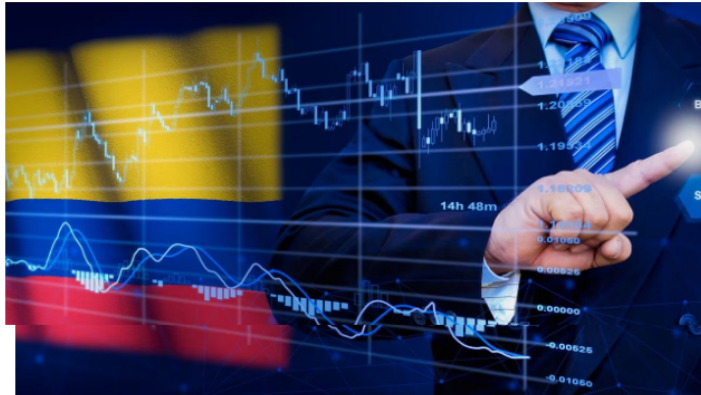
Los datos de inflación en Estados Unidos dieron un respiro a la BVC.

La Bolsa de Valores de Colombia y la acción de Ecopetrol siguen en medio de una fuerte volatilidad e incertidumbre, pero este martes -14 de marzo- iniciaron con un nuevo intento de repunte que, por ahora, ubica la mayoría de sus indicadores en terreno positivo, pese a que las noticias desde el pasado viernes no son las mejores. Así mismo, la necesidad de datos que calmen los ánimos sigue imperando entre los operadores de esta plaza de inversiones, que en menos de una semana cayó a sus niveles más bajos de 2023.