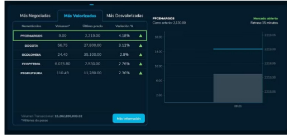
Este fue un buen comienzo para la BVC.

Otra acción que también tuvo un buen arranque fue Ecopetrol, que pasó de vivir dos desplomes bastante fuertes entre viernes y lunes, a ubicarse como la más negociada por ahora y ver cómo sus acciones crecen un sorprendente 2,76 % para quedar con un valor por unidad de 2.530 pesos. No obstante, hay que tener en cuenta que los precios internacionales del petróleo no la pasan bien y en este momento caen entre un -0,80 % y un -1,06 % para las referencias Brent y WTI.