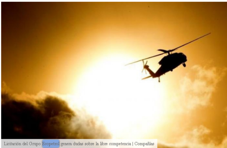
Licitación del Grupo Ecopetrol genera dudas sobre la libre competencia | Compañías

Hace una semana la empresa Cenit , filial del Grupo Ecopetrol , notificó a los interesados en el Mecanismo de Elección CEN1-20222652, cuyo objeto es la "servicio de transporte de personal y carga en helicóptero", para las operaciones de diversas empresas del Grupo Ecopetrol , que decidieron cancelar parcialmente la etapa 2, para la prestación de estos servicios entre abril de 2023 y marzo de 2028.