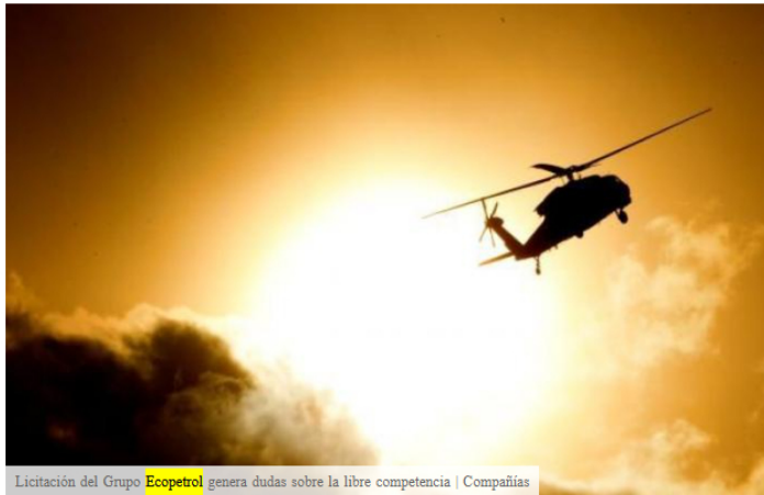
Licitación del Grupo Ecopetrol genera dudas sobre la libre competencia | Compañías

Hace una semana la empresa Cenit , filial del Grupo Ecopetrol , notificó a los interesados en el Mecanismo de Elección CEN1-20222652, cuyo objeto es la "servicio de transporte de personal y carga en helicóptero", para las operaciones de diversas empresas del Grupo Ecopetrol , que decidieron cancelar parcialmente la etapa 2, para la prestación de estos servicios entre abril de 2023 y marzo de 2028.