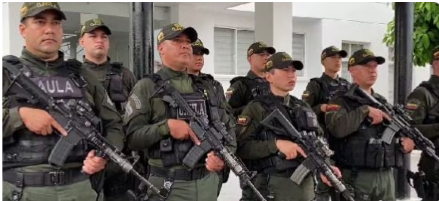
Comando Especial Antiextorsión está en Barrancabermeja.

Ante este preocupante panorama y en vista de este trimestre de 2023, donde ya se han registrado varios hechos de violencia, las autoridades locales solicitaron apoyo del mando nacional para reforzar la seguridad del Puerto Petrolero y así poder brindarles garantías a los lugareños.