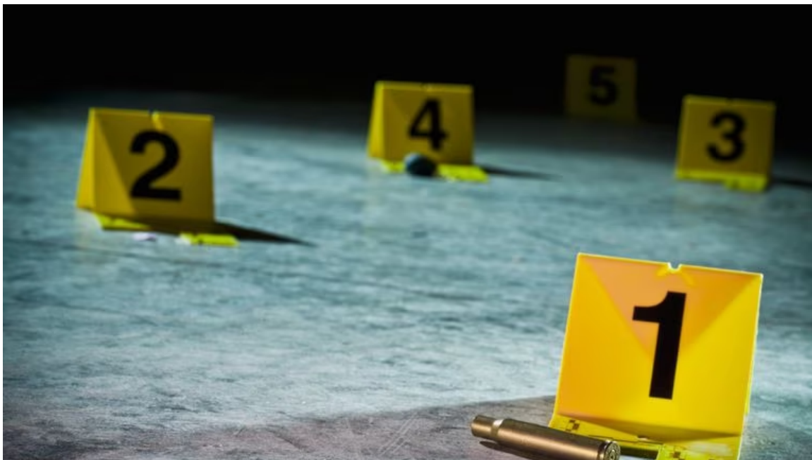
Según las autoridades, la mayoría de estos actos está relacionada con microtráfico.

Hasta el momento, por los crímenes que tiene azotado a Barrancabermeja y Puerto Wilches, las autoridades no han reportado capturas. Sin embargo, indicaron que se están adelantando las investigaciones correspondientes para establecer las causas y responsables de estos crímenes, con los cuales se eleva a 32 el número de víctimas de atentados sicariales en lo corrido de 2023.