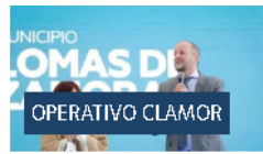
UNICIPIO OMAS D OPERATIVO CLAMOR

Axel Kicillof confirmó que va por su reelección y espera por Cristina