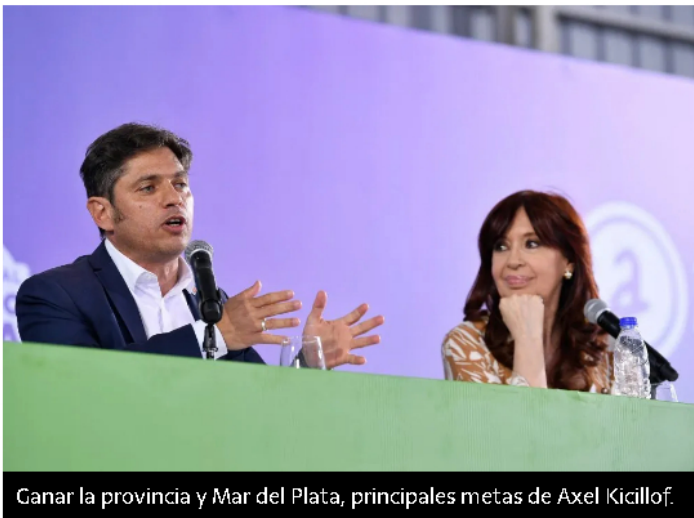
Ganar la provincia y Mar del Plata, principales metas de Axel Kicillof.