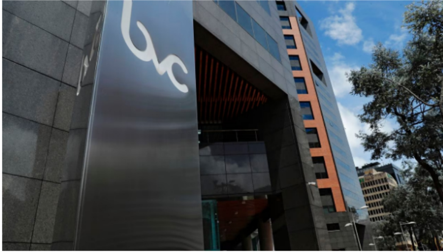
La Bolsa de Valores de Colombia no fue ajena a la crisis de confianza que hay en los mercados bursátiles de todo el mundo.

La Bolsa de Valores de Colombia y Ecopetrol no tuvieron arranque de semana y este lunes -13 de marzo- iniciaron con todos sus indicadores en rojo y fuertes caídas, uniéndose de esta forma a la tendencia que hay en los mercados accionarios de todo el mundo, luego del anuncio de bancarota del Silicon Valley Bank en Estados Unidos, que avivó los temores de una crisis económica muy fuerte por culpa de las recientes subidas de tasas de interés que se han venido ordenando y el fantasma de la recesión que una vez más ronda entre las grandes potencias.