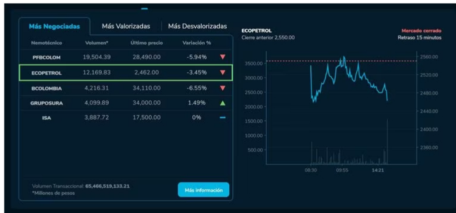
El presidente Joe Biden intentó tranquilizar este lunes a los estadounidenses al afirmar que el sistema bancario es “seguro”, pese a la quiebra o cierre de tres bancos en menos de una semana.

Poco conocido por el público en general, SVB se especializaba en financiar nuevas empresas y se había convertido en el decimosexto banco más grande de Estados Unidos por activos: a fines de 2022 tenía 209.000 millones en activos y aproximadamente 175.400 millones en depósitos. Desde el pasado viernes ha sido noticia esta entidad, puesto que su quiebra significa un llamado de alerta, sobre todo en el próximo cercano.