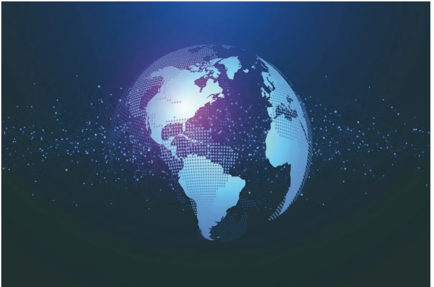
Latam day ahead-noticias e indicadores de américa latina (13 de marzo)