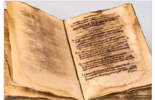
Profecías. Quisieron subastar un manuscrito de Nostradamus pero descubrieron que había sido robado en Italia