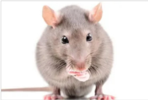
Hallazgo. Implantaron células humanas en ratones recién nacidos y lograron influir en su comportamiento