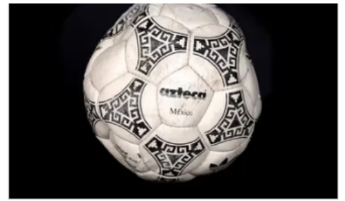
Reliquia maradoniana. La pelota de la "mano de Dios" se subastó por una cifra millonaria en Londres