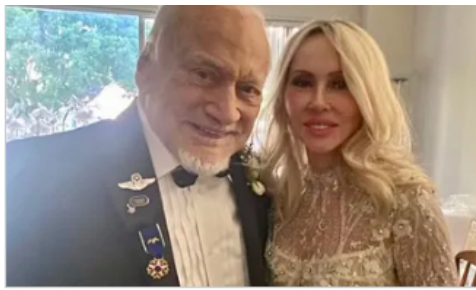
"Caminando sobre la luna". El astronauta Buzz Aldrin se casó al cumplir 93 años