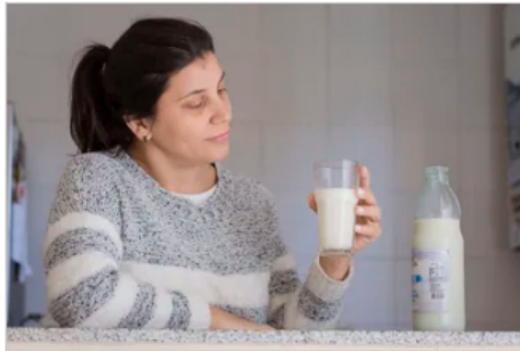
Tendencia "foodie". ¿Es seguro el consumo de leche cruda y sus productos lácteos derivados?