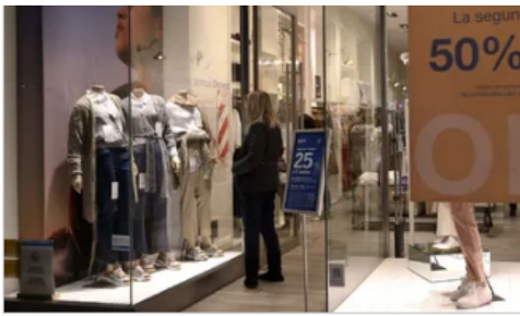
Enojo y decepción. La crisis económica derrumba los últimos refugios de la clase media