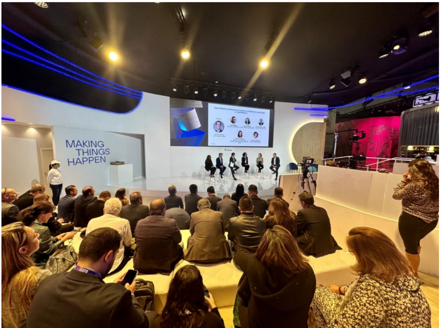
Hispan Telefónica / Cierre de brechas digitales

La compañía destacó sus planes, dando a conocer casos que ya se están implementando en la región bajo alianzas con terceros y nuevos modelos operativos de infraestructura.