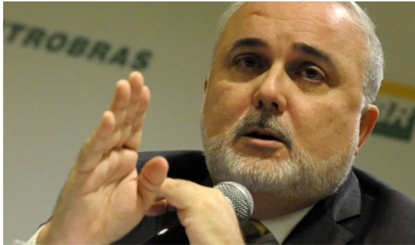
Jean Prates, Presidente Petrobras