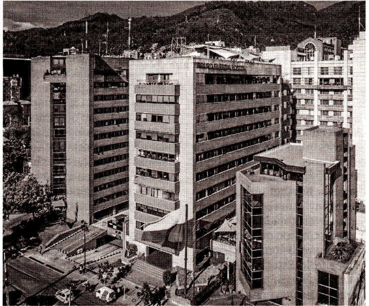
GRUPO ENERGÍA BOGOTÁ

Para la SIC, Ecopetrol pretendió reproducir casi en su totalidad a la marca opositora, lo que hubiera generado riesgo de confusión.