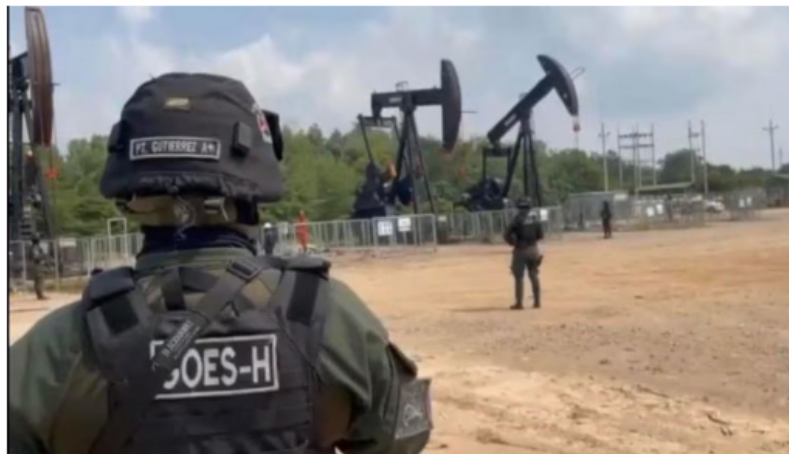
Las autoridades custodian las instalaciones de la empresa afectada.

Ante este flagelo, la Policía y el Ejército Nacional intensifican los patrullajes en el sector donde se presentó el ataque que, al parecer, fue perpetrado por integrantes del grupo criminal ELN.