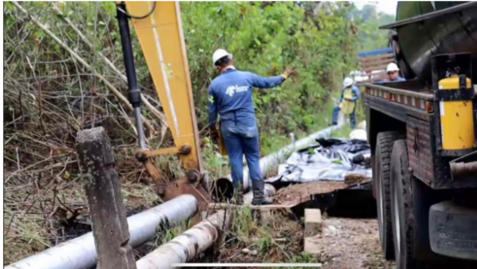
Desde el 2021 esta empresa petrolera ha sido objeto de once atentados.

Las autoridades policiales del Magdalena Medio refuerzan la seguridad del municipio de Barrancabermeja, en el departamento de Santander, donde se registró un atentado contra un oleoducto de la empresa Ecopetrol .