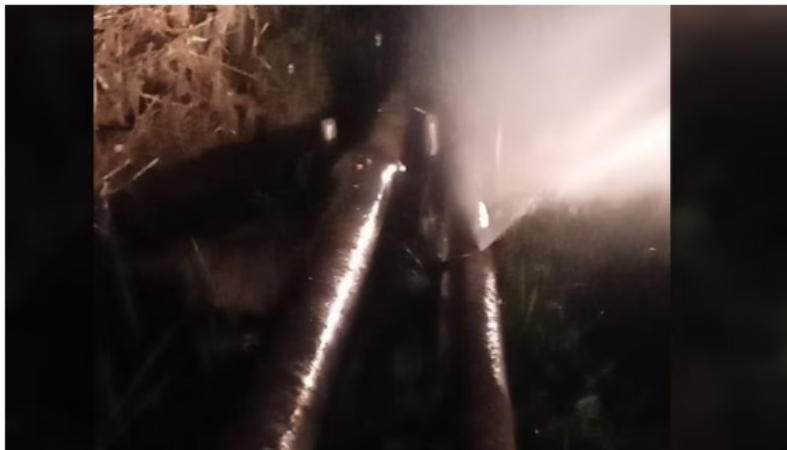
Oleoducto de Ecopetrol en Barrancabermeja fue atacado este lunes 6 de marzo.

El primero fue un atentado en “la línea de transferencia de 12 pulgadas que transporta crudo desde la estación La Cira Infantas 1 a la estación La Cira Infantas 3 A, en campo 45”, según detalló en su momento Ecopetrol ; y el segundo ocurrió en el oleoducto que transporta crudo desde la Planta Deshidratadora El Centro a la refinería de Barrancabermeja.