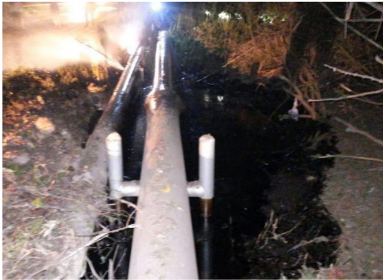
La explosión afectó la línea de agua que va hacia planta deshidratadora Lisama del campo de producción La Cira Infantas.

Este incidente no dejó víctimas, pero sí provocó daño ambiental, por la pérdida de contención de los fluidos derramados, e incertidumbre en las comunidades aledañas a las operaciones de Ecopetrol .