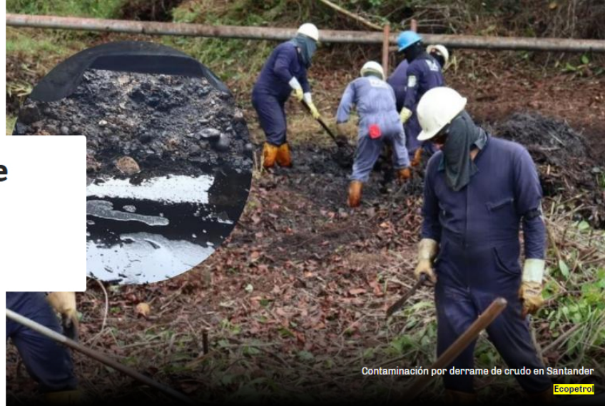
Contaminación por derrame de crudo en Santander