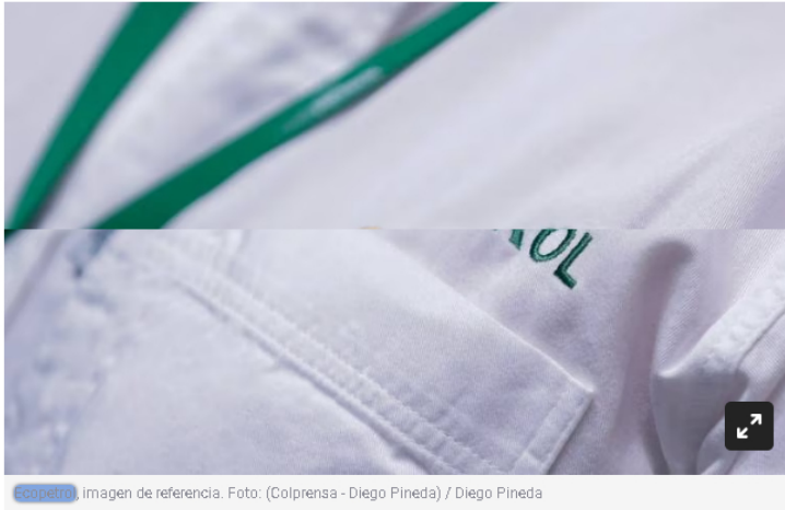
Imagen de referencia.

El atentado fue al oleoducto que transporta el crudo desde El Centro hasta la planta deshidratadora Lisama en Barrancabermeja.