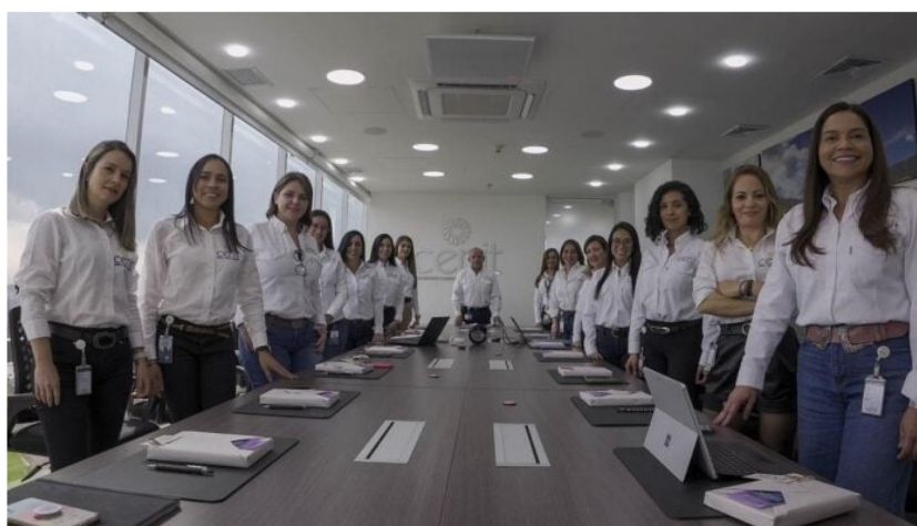
Cenit, equidad de género.

Por Yennyfer Sandoval - Periodista Minería y Energía - 2023-03-07