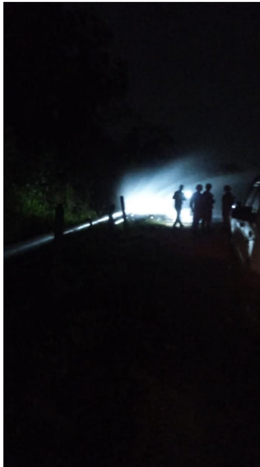
Atentado oleoducto Ecopetrol

Una explosión en el sistema de tuberías destinadas para el transporte de hidrocarburos de Ecopetrol en el corregimiento El Centro, en el Distrito Especial de Barrancabermeja, prendió las alarmas de las autoridades.