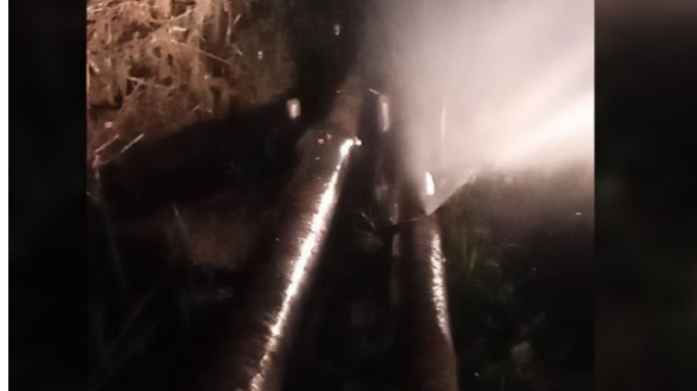
Oleoducto de Ecopetrol en Barrancabermeja fue atacado este lunes 6 de marzo.

Una explosión en el sistema de tuberías destinadas para el transporte de hidrocarburos de Ecopetrol en el corregimiento El Centro, en el Distrito Especial de Barrancabermeja, prendió las alarmas de las autoridades.