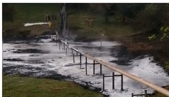
Atentado oleoducto Ecopetrol

El primero fue un atentado en “la línea de transferencia de 12 pulgadas que transporta crudo desde la estación La Cira Infantas 1 a la estación La Cira Infantas 3 A, en campo 45”, según detalló en su momento Ecopetrol , y el segundo ocurrió en el oleoducto que transporta crudo desde la Planta Deshidratadora El Centro a la refinería de Barrancabermeja.