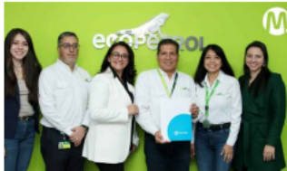
Ecopetrol hace historia al verificar su huella de agua