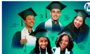
Ecopetrol lanza convocatoria abierta a los mejores bachilleres del país