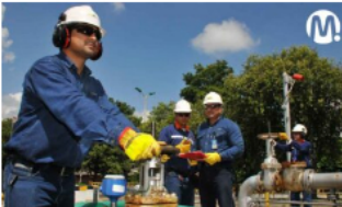
Ecopetrol le dejó al país $42,4 billones en 2022