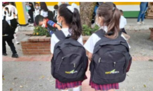
Ecopetrol entregará 19.823 kits escolares en el Meta