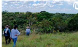
Ecopetrol contribuye a la protección de más de 1.700 hectáreas de bosque en el Meta