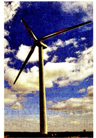
Se asignaron 7,5 gigavatios de los 56 que se presentaron.

Países Bajos se posicionó como el cuarto país al que más se comercializa en el exterior, con una participación del 6,2%. Continúa México (4,1%), Brasil (3,5%), España (3,5%) y demás países con 42,5%. Ahora bien, cabe recordar que uno de los productos que más se comercializan en el exterior es el café, por lo que de los US$239,7 millones declarados en enero de 2023; 67,3% se embarcaron en el mismo mes y 32,7% en diciembre 2022. ☞