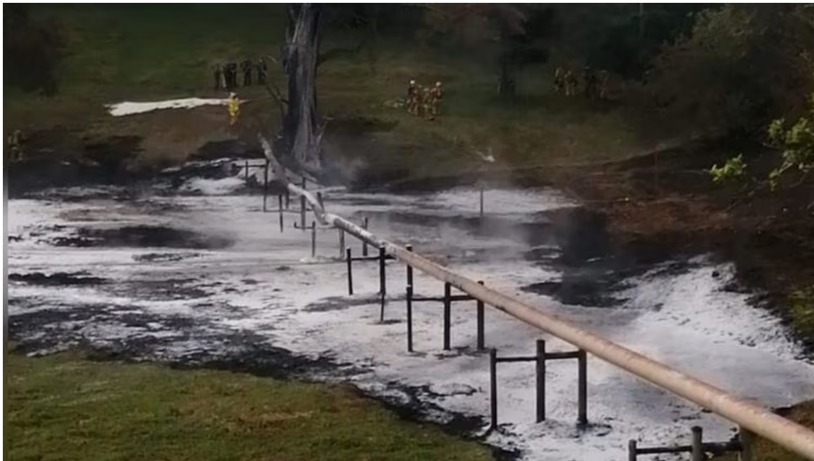
Atentado oleoducto Ecopetrol

El primero fue un atentado en “la línea de transferencia de 12 pulgadas que transporta crudo desde la estación La Cira Infantas 1 a la estación La Cira Infantas 3 A, en campo 45”, según detalló en su momento Ecopetrol; y el segundo ocurrió en el oleoducto que transporta crudo desde la Planta Deshidratadora El Centro a la refinería de Barrancabermeja.