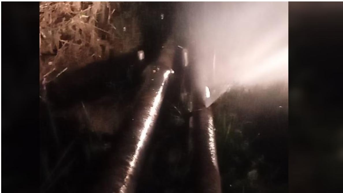
Oleoducto de Ecopetrol en Barrancabermeja fue atacado este Lunes 6 de marzo.