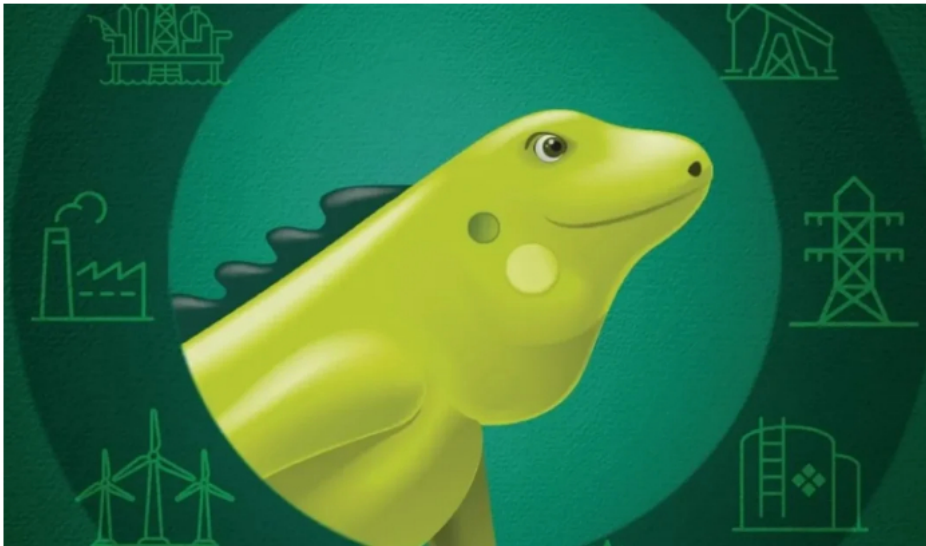
Ecopetrol entregará dividendos históricos.

La acción de Ecopetrol cerró el pasado viernes en $2.725 pesos y para 2023 espera entregar un dividendo de $593 por acción.