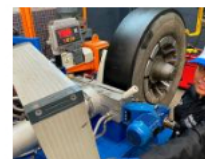
Bridgestone abre plantas en Cúcuta y dos ciudades más