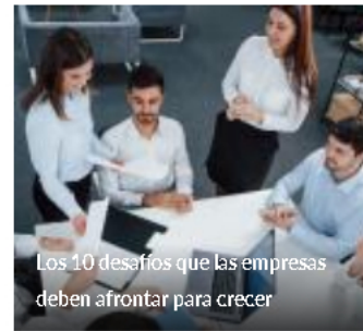
Los 10 desafíos que las empresas deben afrontar para crecer

Para el régimen individual o para quienes aportan a los fondos de pensiones, los aportes voluntarios a su pensión significan un incremento en la mesada pensional, desde el momento en que empieza a recibirla.