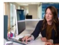
Estudio recomienda a las empresas abordar urgentemente la insatisfacción laboral