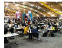
Macrorrueda internacional de turismo dejó oportunidades de negocios por más de 54 millones de dólares