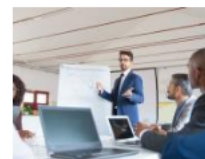
¿Cómo avanza la recuperación de los puestos de trabajo presencial en Colombia?