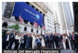
Noticias Del Mercado Financiero

Tecnoglass entra al top 10 de empresas con mayor capitalización bursátil de Colombia