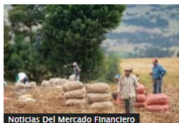
Noticias Del Mercado Financiero

Tecnoglass entra al top 10 de empresas con mayor capitalización bursátil de Colombia