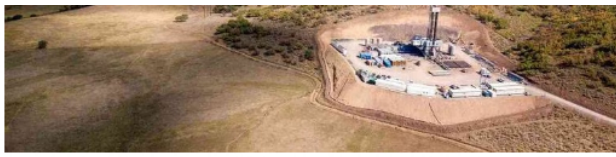
El Consejo de Estado prohibió por ahora el fracking en Colombia y avaló las pruebas piloto con fines de investigación.

SEMANA: Ha habido una caída en el precio del petróleo. ¿A qué precio debería producir rentablemente Ecopetrol ?