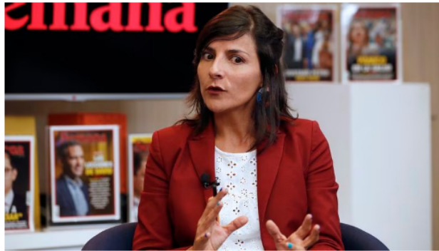
La Ministra de Minas y Energía, Irene Vélez, ha estado en el ojo del huracán por el tema de las exploraciones petroleras.