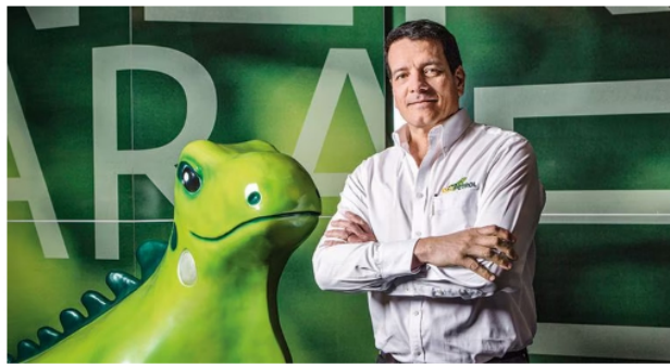
Felipe Bayón castró con éxito el impacto de la pandemia, siendo Ecopetrol de las pocas petroleras en el mundo que dio utilidades en 2020 y que capitalizó la "minibonanza" de 2022.

F.B.: Ecopetrol ha tenido momentos difíciles y de crisis, pero ha sabido sobreponerse a y salir fortalecida. De otro lado, Ecopetrol tiene un equipo humano de clase mundial, con compromiso, ganas y conocimiento, eso hay que protegerlo para que Ecopetrol siga siendo líder.