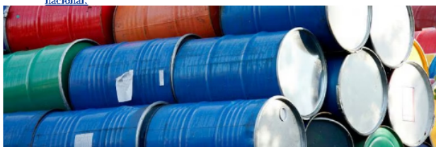
En diciembre, Ecopetrol estubo sobre los 734.000 barriles de petróleo.

F.B.: Hay dos cosas: si uno mira 2022, dividendos, regalías e impuestos son 42 billones de pesos, en el pasado en promedio eran entre 20 y 25 billones. Es un montón de plata, es una reforma tributaria todos los años. El año pasado fueron dos reformas tributarias. Para 2023 se está proponiendo en dividendos el más alto en la historia de Ecopetrol: 593 pesos por acción. Un pedazo es dividendo ordinario: 60 por ciento y 13 por ciento es extraordinario. Es un reconocimiento de un buen año para nuestros 255.000 accionistas, entre ellos al gobierno nacional.