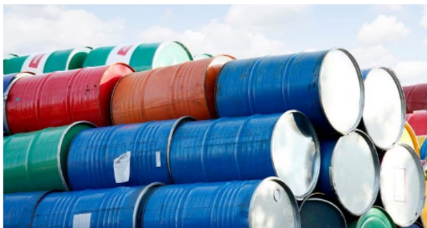
En diciembre, Ecopetrol estubo sobre los 734.000 barriles de petróleo.

pandemia. En las refinerías, el año pasado ampliamos la capacidad de la de Cartagena de 150.000 a 200.000 barriles, transportamos más de un millón de barriles. Abrimos una oficina en Singapur, que entregó mucho más de lo que estábamos esperando en términos de resultado. Hicimos inversiones de más de 5.400 millones de dólares, que fueron muy eficientes. Todas esas cosas suman.