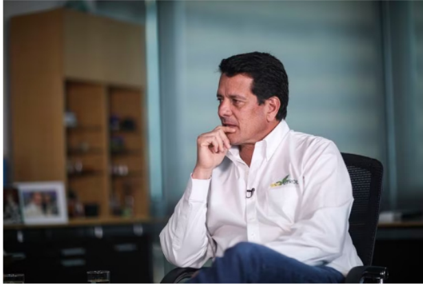
Felipe Bayón aseguró que hay que seguir realizando exploración y está en contra de importar gas desde Venezuela. 01 DE MARZO 2023

exploratorias nuevas. Y muchas de esas, si son exitosas, abren otras. Tenemos oportunidad de hacerlo, pero creo que hay que mirar otras áreas que hoy no se están viendo. Sí creo que habría que pensar en dar contratos nuevos y fijense que los mensajes se han ido moderando, hemos trabajado mucho con el Ministerio de Minas y con el de Hacienda para poner los datos sobre la mesa y que los tomadores de decisiones las tomen de manera informada.