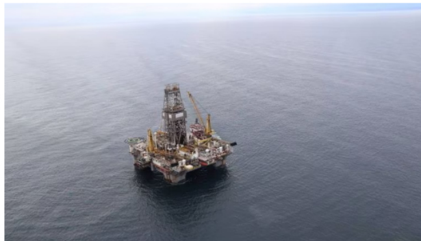
El pozo Uchuva-1 está a cerca de 80 kilómetros del campo de gas Chuchupa.

F.B.: Hoy en día Ecopetrol tiene producción costa afuera en Chuchupa-Ballena y el operadore es Hocoil, una empresa cien por ciento del Grupo Ecopetrol . En esos yacimientos se producen unos 110 millones de pies cúbicos todos los días, 10 por ciento del mercado colombiano. En términos de exploración hicimos el año pasado una operación de perforación en el pozo Uchuva 1 con Petrobras, ahí somos socios con esta compañía brasileña, una parceria espectacular con ellos. Son técnicamente de lo mejor que hay en el mundo para este desarrollo de aguas profundas. Y el otro el otro socio que tenemos en el pozo Gorgon es Shell, una compañía mundial líder en exploración, comercialización y desarrollo de gas, entonces tenemos dos socios de clase mundial.