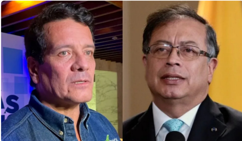
Felipe Bayón, presidente de Ecopetrol, le envió un mensaje al presidente de Colombia, Gustavo Petro.