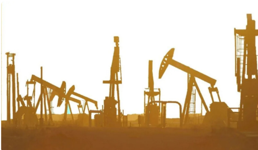
Bayón asegura que debe haber claridad sobre la continuidad de nuevos contratos de petróleo y gas en Colombia.

Eso sí, fue enfático en que para que esto sea una realidad, se debe mantener el negocio. “El mundo va a seguir consumiendo petróleo, tenemos que atacar las emisiones”, añadió.