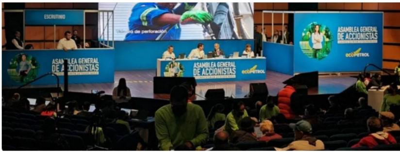
Felipe Bayón saldrá de Ecopetrol tras la Asamblea General de Accionistas del 30 de marzo de 2023.

Y agregó que han tenido diversos debates en la Junta de Ecopetrol con los ministerios de Minas y Energía y Hacienda.