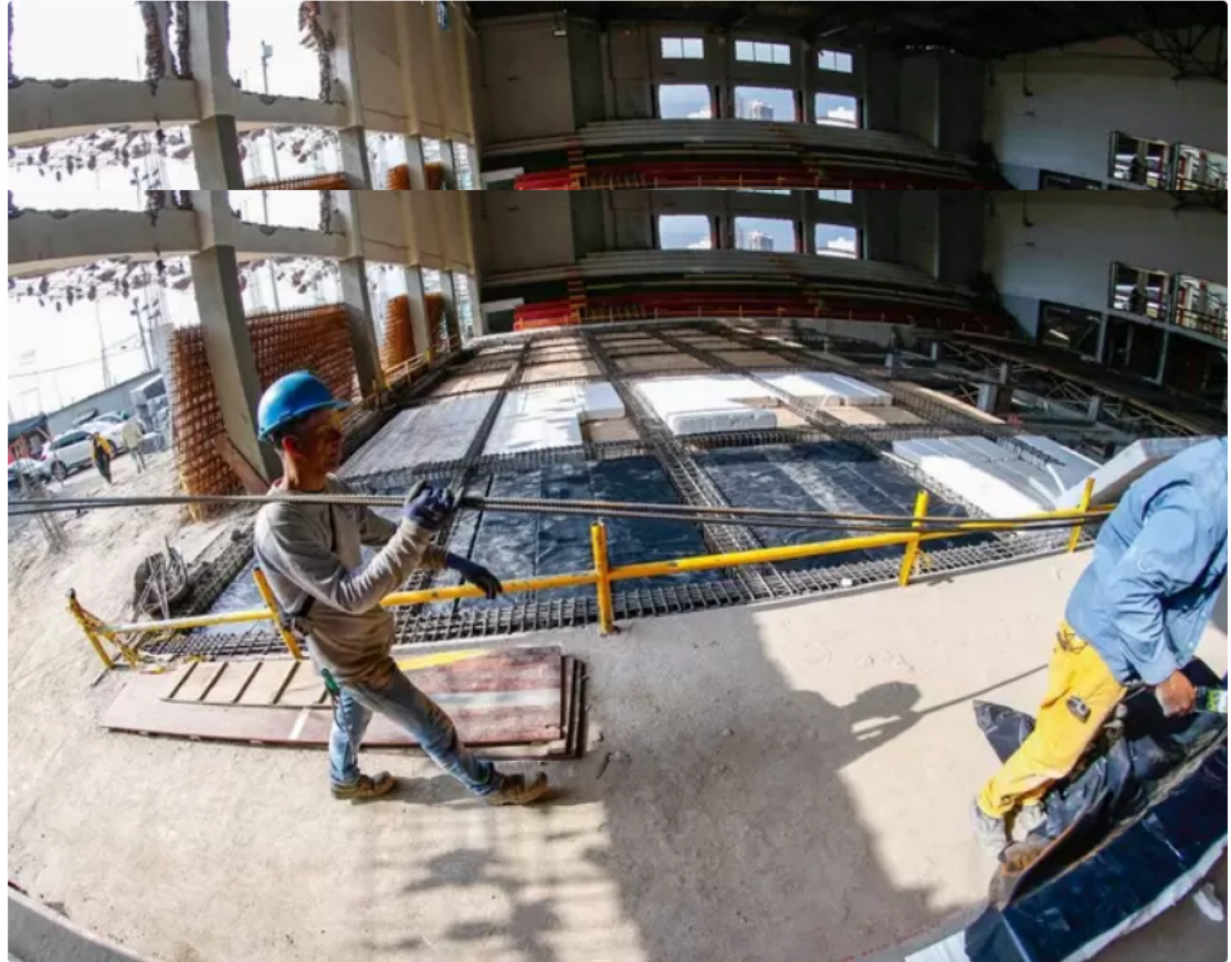
Secretaría Jurídica responde a cuestionamientos