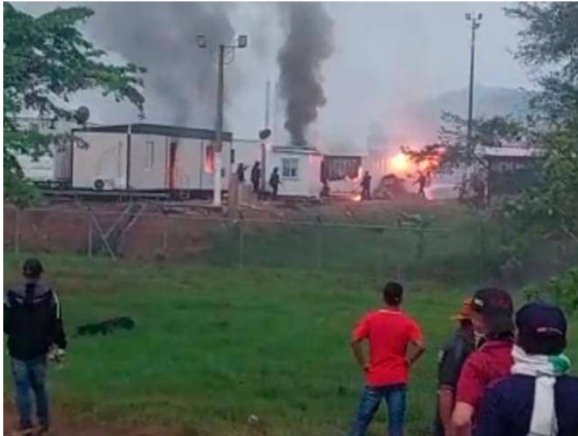
En la mañana de este jueves 2 de marzo, los campesinos se tomaron las instalaciones de la petrolera Emerald Energy.

El grupo de campesinos lleva 40 días protestando en el sector de Los Pozos, en San Vicente del Caguán.