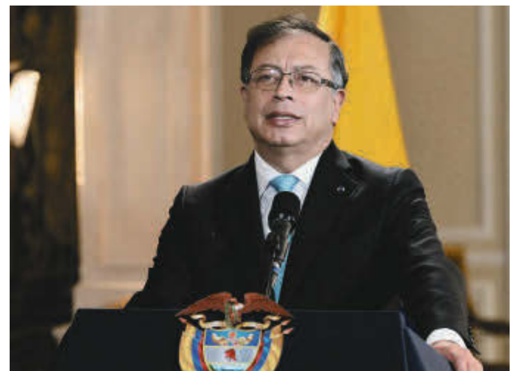
Varias cartas han llegado últimamente al despacho del presidente Gustavo Petro pidiéndole prudencia con sus facultades.

Los exfuncionarios advirtieron que, aún con buenas intenciones, las malas decisiones pueden retroceder al país 50 años y “conducir a una situación que todos lamentaremos. Hemos recorrido una historia con costosos aprendizajes y debemos evitar repetir los errores” ■