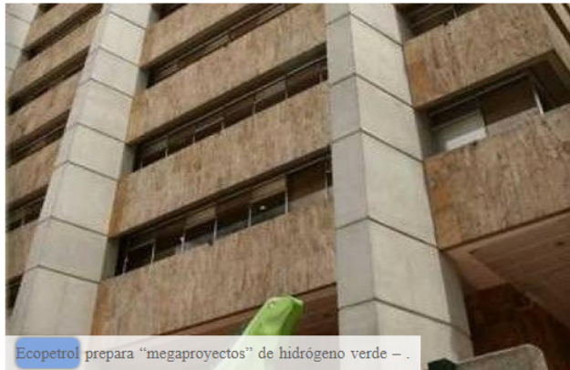
Ecopetrol prepara “megaproyectos” de hidrógeno verde - .

NEGOCIO Shirley ✓ Noticias about 2 hours ago REPORT